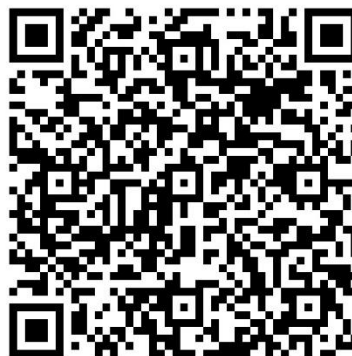
微信扫码加入群聊